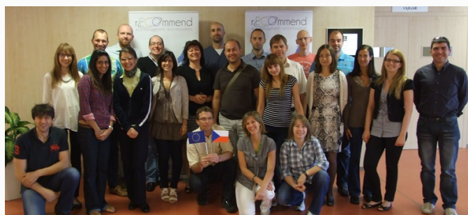
Pierwszy szczyt roboczy, Czeskie Budziejowice, Czechy